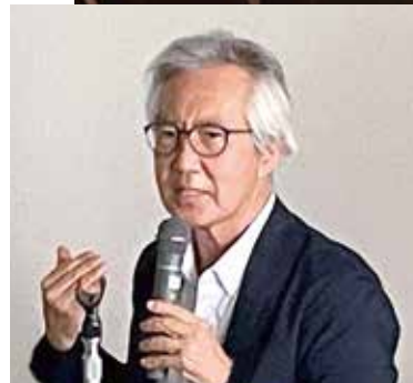
がん治療セミナー開催時の様子です。 感染対策を十分に実施し、 多くの方にご参加いただきました。