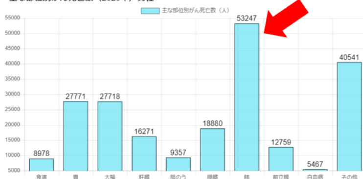
主な部位別がん死亡数(2020年)男性